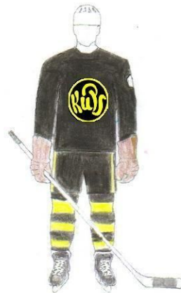
KuPS 51, 52, 53. + juniorit 54, 55, 56.