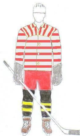
Eräveikkojen peliasu kausilla 1950 ja 1951. Saattoi olla jo 1949.