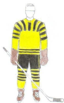
KuPS 54, 55, 56. KalPa 57, 58.