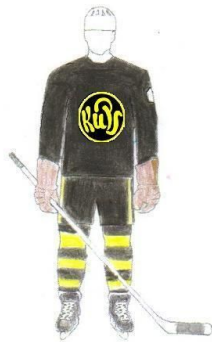
KuPS 51, 52, 53. • Junnuit 54, 55, 56.